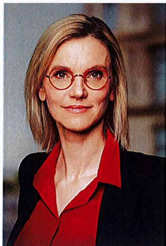
Agnès Pannier-Runacher, ministre de la Transition énergétique